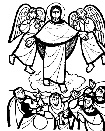
Reunirá a sus elegidos de los cuatros vientos DOMINGO XXXIII DEL TIEMPO ORDINARIO

En aquel tiempo, dijo Jesús a sus discípulos: -“En aquellos días, después de esa gran angustia, el sol se hará tinieblas, la luna no dará su resplandor, las estrellas caerán del cielo, los astros se tambalearán. Entonces verán venir al Hijo del hombre sobre las nubes con gran poder y majestad; enviará a los ángeles para reunir a sus elegidos de los cuatros vientos, de horizonte a horizonte. Aprendan de esta parábola de la higuera: Cuando las ramas se ponen tiernas y brotan las yemas, deducen ustedes que el verano está cerca; pues cuando vean ustedes suceder esto, sepan que él está cerca, a la puerta. Les aseguro que no pasará esta generación antes que todo se cumpla. El cielo y la tierra pasarán, mis palabras no pasarán, aunque el día y la hora nadie lo sabe, ni los ángeles del cielo ni el Hijo, sólo el Padre.