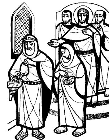
Esa pobre viuda ha echado más que nadie DOMINGO XXXII DEL TIEMPO ORDINARIO

En aquel tiempo, enseñaba Jesús a la gente y les decía: -"¡Cuidado con los escribas! Les encanta pasearse con amplio ropaje y que les hagan reverencia en la plaza; buscan los asientos de honor en las sinagogas y los primeros puesto en los banquetes; y devoran los bienes de la viuda, con pretexto de largos rezos. Éstos recibirán una sentencia más rigurosa". Estando Jesús sentado enfrente del arca de las ofrendas, observaba a la gente que iba echando dinero: muchos ricos echaban en cantidad; se acercó una viuda pobre y puso dos monedas de poco valor. Llamando a sus discípulos, les dijo: -"Les aseguro que esa pobre viuda ha puesto en el arca de las ofrendas más que nadie. Porque los demás han echado de lo que le sobra, pero ella, en su pobreza, ha dado todo lo que tenía para vivir".