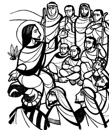
Llamó a los doce y los fue enviando DOMINGO XV DEL TIEMPO ORDINARIO

En aquel tiempo, llamó Jesús a los Doce y los fue enviando de dos en dos, dándoles autoridad sobre los espíritus inmundos. Les encargó que llevaran para el camino un bastón y nada más, pero ni pan, ni alforja, ni dinero suelto en la faja; que llevaran sandalias, pero no una túnica de repuesto. Y añadió: "Cuando entren en una casa, quédense en ella hasta que se vayan de aquel lugar. Y si en algún sitio no los reciben ni los escuchan, márchense de allí, sacúdanse el polvo de los pies, para que les sirva a ellos de advertencia". Ellos salieron a predicar la conversión, echando muchos demonios, ungían con aceite a muchos enfermos y los curaban.