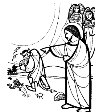
Se dejaba tentar por Satanás y los ángeles le servían DOMINGO I DE CUARESMA

En aquel tiempo, el Espíritu llevó a Jesús al desierto. Se quedó en el desierto cuarenta días; dejándose tentar por Satanás; vivía entre las fieras salvajes, y los ángeles le servían. Cuando arrestaron a Juan, Jesús se marchó a Galilea a proclamar el Evangelio de Dios. Decía: "Se ha cumplido el plazo, está cerca el reino de Dios: conviértanse y crean en el Evangelio".